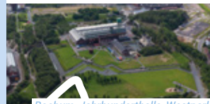
Bochum, Jahrhunderthalle, Westpark

1. Pause: Sprockhövel, Schulgebäude 2. Pause: Hattingen, Heinrichshütte Ziel: Bochum, Westpark, Jahrhunderthalle